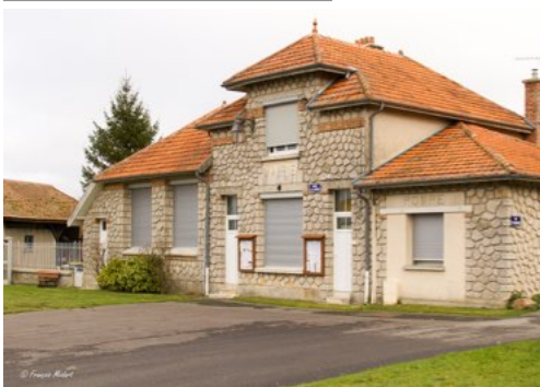
La Mairie de Gernicourt