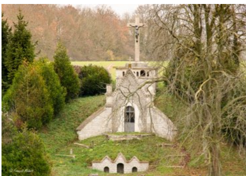
La Chapelle Saint-Rigobert