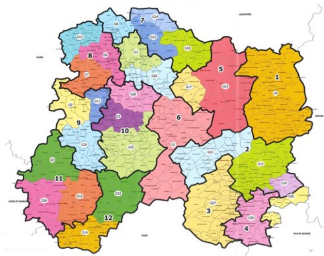
Projet de schéma départemental de l'intercommunalité dans la Marne proposée par le Préfet

Nous avons refusé par 13 voix contre et 2 abstentions la carte proposée par le Préfet. Nous avons dit non à une nouvelle communauté de communes qui associe les communautés de communes de « Rives de la Suippe », « Vallée de la Suippe », « Beine-Bourgogne » et « Nord-Champenois » pour former un ensemble de 40 communes et de 33 425 habitants. Cette intercommunalité s'étendrait de Cormicy à Aubérive en longeant le territoire de la communauté urbaine « Reims-Châlons ». Cette communauté urbaine s'étirerait, quant à elle, de la Neuville à Sommesous, formant un sillon de développement en ignorant nos territoires, nous resterions coincés entre Reims et l'Aisne sans perspective de développement en connaissant une baisse d'attractivité.