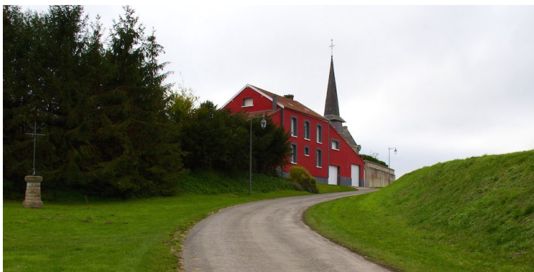
La Rue de l'Église